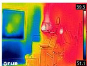
Parede externa não isolada