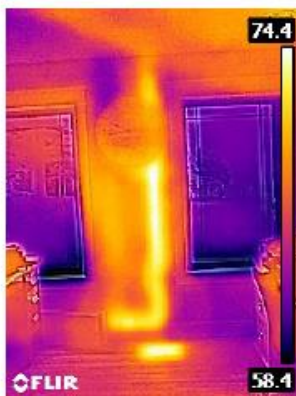
Tubo de drenagem aquecido na parede